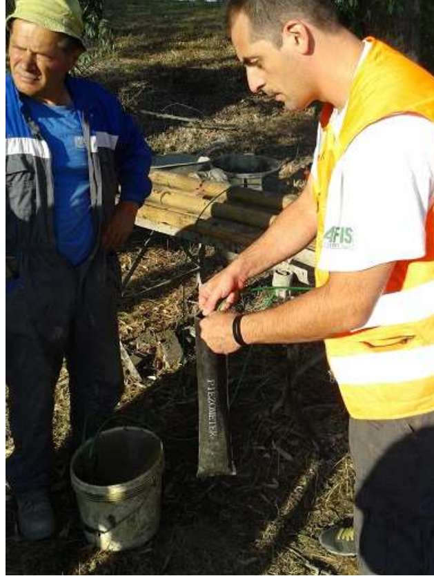
Fig. 3 – Piezometro elettrico – fase di installazione in foro