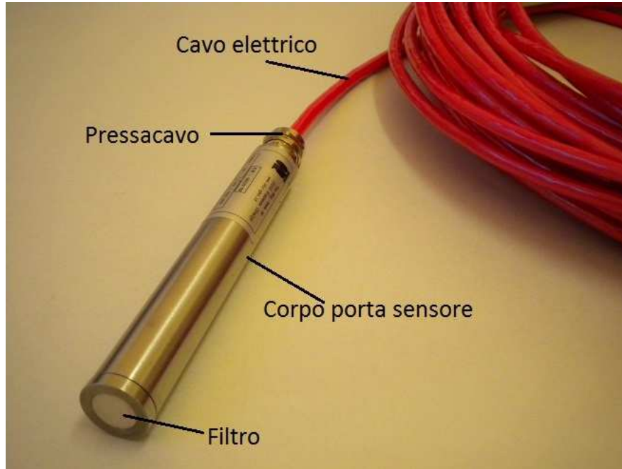
Fig. 1 – Piezometro elettrico

all'umidità anche sui terminali di lettura.